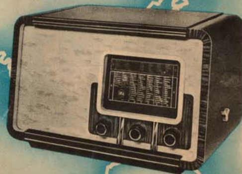
EKA NAGYSZUPER 414

kis csőszámú egyen-váltóáramú (univerzál) nagyteljesítményű szuperkészülék, 17—2000 m-ig három hullámsávon bármilyen árammennél és minden feszültségnél egyetlen gombbeállítással tökéletes külföldvételt nyújt. Feszültségátkapcsolása a legegyszerűbb, a különböző áramnemeknél átkapcsolásra nincs szükség. Fémdíszítésű, elegáns díofaszekrény.