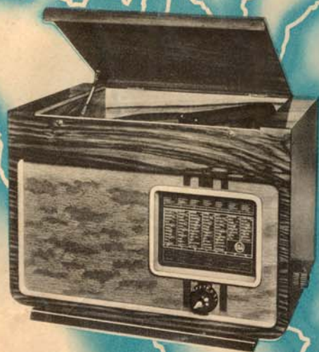
EKA ZENEGÉP 413/G

célszerű kombinációja az EKA KISSUPER 413-nak és egy nagyteljesítményű elektrogramofonnak. A tökéletes hangvisztaadás a különleges kristály pick-up-nek és a készülék kiváló elektro-akusztikai kiképzésének köszönhető. A gramofonrész teljesen zajtalan járású, minden feszültségre átkapcsolható motorral, 30 cm-es luxustányérral, fordulatszabályozóval, automatikus támadogolóval, külön hangerőszabályozóval, tehát egy luxuskészülék minden felszerelésével rendelkezik.