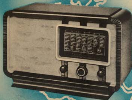
EKA KISSZUPER 413/U

csak csőszáma miatt „kis” szuper, teljesítménye azonban nagyobb, mint az egykori „óriás”-szupereké. Váltóáramról működik, 17—2000 m-ig három hullámsávon több mint 100 állomás, nappal is jó külföldvétel, egyetlen gombbeállítással. Az ismert kiváló EKA-hangminőség, amely folyamatos hangszabályozó révén az egyéni ízlésnek megfelelően szabályozható. Fémdíszítésű elegáns díofaszekrény.